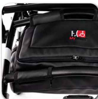
KOSZ NA ZAKUPY