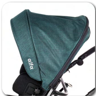
DASZEK Z OKIENKIEM