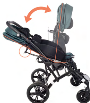
REGULACJA KĄTA POCHYLENIA OPARCIA