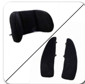
ZAGŁÓWEK I ELEMENTY BOCZNE