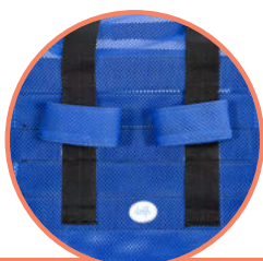
STABILIZUJĄCE PASY NA NOGI