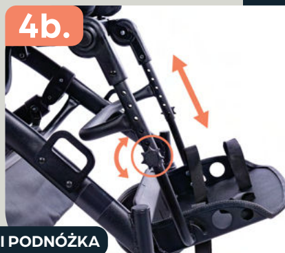
REGULACJA WYSOKOŚCI PODNÓŻKA