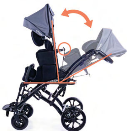
REGULACJA POCHYLENIA OPARCIA