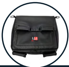
KOSZ NA ZAKUPY