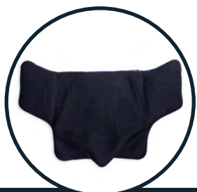
PODUSZKA SIEDZISKA Z KLINEM