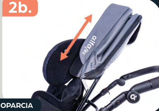
REGULACJA WYSOKOŚCI OPARCIA