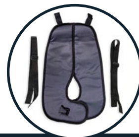
PASY ODWODZĄCO- STABILIZUJĄCE