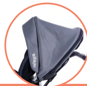
REGULOWANA BUDKA Z OKIENKIEM