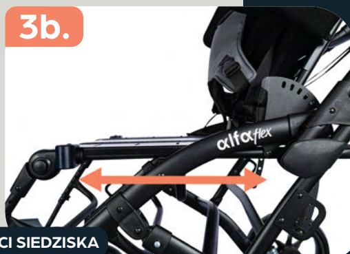
REGULACJA GŁĘBOKOŚCI SIEDZISKA