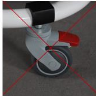
Fig. 9 Incorrecto

b) coloque el asiento en los enganches de la base. El asiento está correctamente ajustado si se escucha un claro sonido de "clic" de ambos enganches del marco (Fig. 10-11).