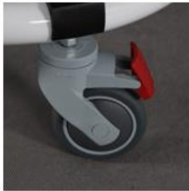
Fig. 8 Correcto

a) bloquee los frenos para mantener la base estable e inmovilizada. (Fig. 8-9).