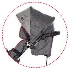
Capota con ventanilla