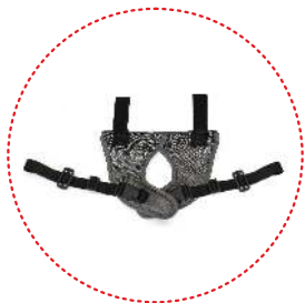
Cinturón de abducción y estabilización