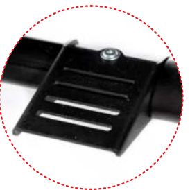
Pie de inclinación