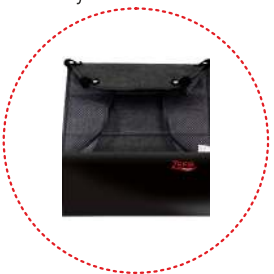
Cesta de compras