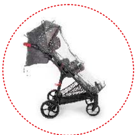
Burbuja de lluvia