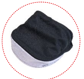
Vordach mit Lüftungspaneel