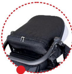
Vordach mit Belüftungspaneel