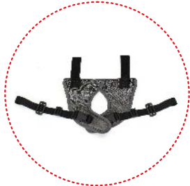
Abduktions- und Stabilisierungsgurte