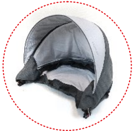
Vordach mit Belüftungspaneel