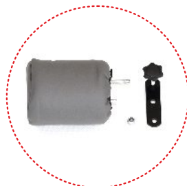
клин с регулировкой