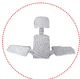
подушка сужающая сиденье