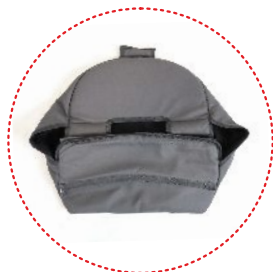
корзина для покупок