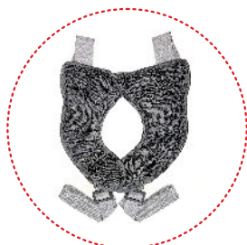
ремни для удержания и стабилизации