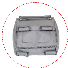
корзина для покупок