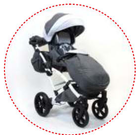
Saco de dormir para piernas