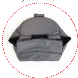
Cesta de compras