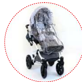
Burbuja de lluvia