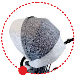
Capota con ventanilla