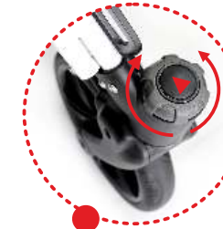
Bloqueo de ruedas direccional