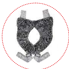
Cinturón de abducción y estabilización