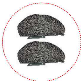
Elementos laterales del asiento