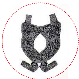
Cinturón de abducción y estabilización