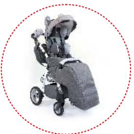
Kit de OSO GRIZZLY (elementos peludos decorativos)