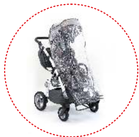
Burbuja de lluvia