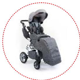
Saco de dormir para piernas