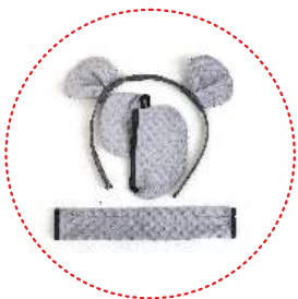
Kit de OSO GRIZZLY (elementos peludos decorativos)