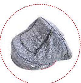
Capota con ventanilla