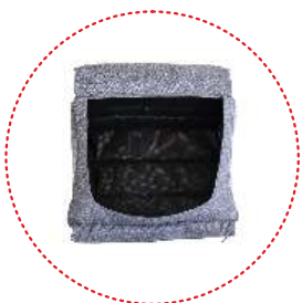
Cesta de compras