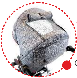
Capota con ventanilla