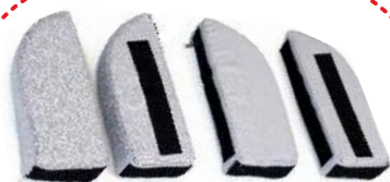
Pasy odwodząco - stabilizujące