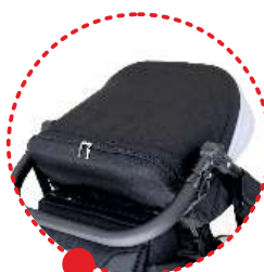
Daszek z okienkiem