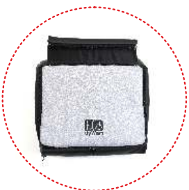
kosz na zakupy