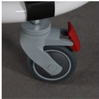
Zdj. 6 Dobrze

a) Zablokować hamulce, aby podstawa pokojowa była stabilna i nieruchoma (Zdj. 6-7).