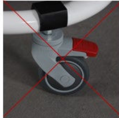
Zdj. 7 Źle

b) nałóż siedzisko w zaczepy podstawy jezdnej. Dociśnij siedzisko, aż do dwóch kliknięć. O prawidłowym założeniu siedziska świadczą wyraźne dźwięki "klik", pochodzące z obu zaczepów podstawy siedziska (Zdj. 8-9).