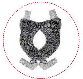
Abduktions- und Stabilisierungsgurte