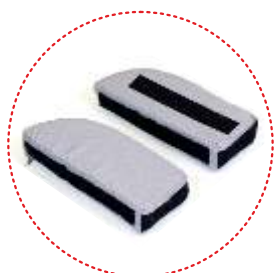
набор регулируемых сужающих вставок