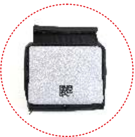
корзина для покупок