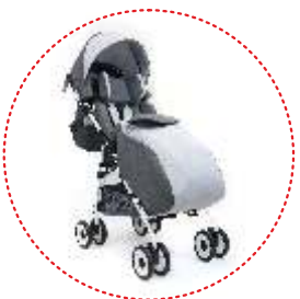
śpiwór na nogi