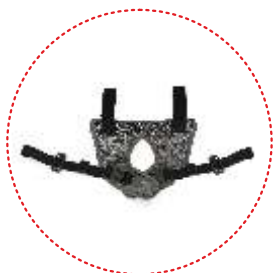
pasy odwodząco - stabilizujące