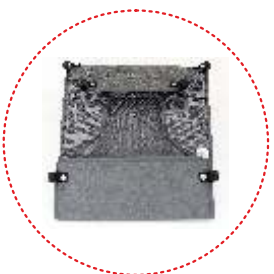
kosz na zakupy