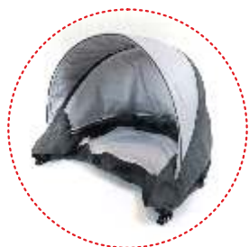
budka z okienkiem