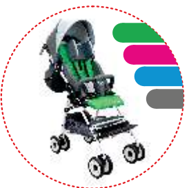
wkładka do wózka