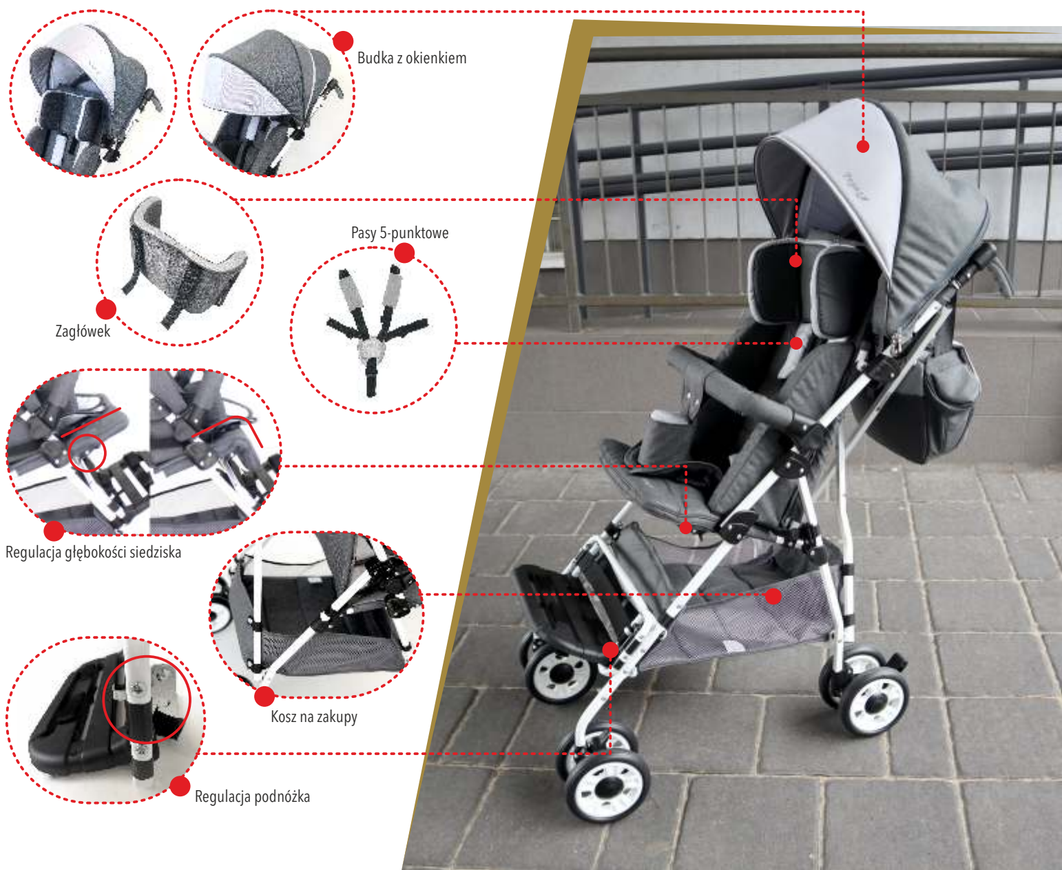
Budka z okienkiem