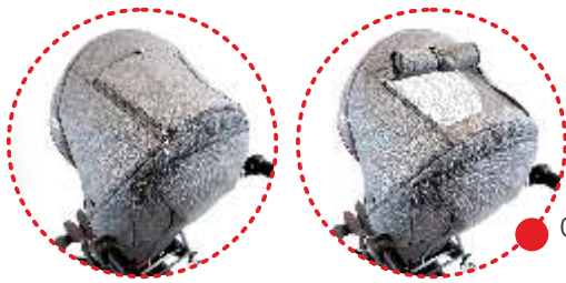
Capota con ventanilla