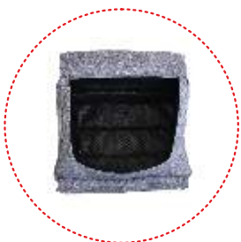
Cesta de compras