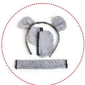
Kit de OSO GRIZZLY (elementos peludos decorativos)