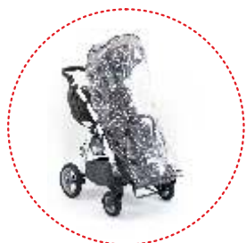
Burbuja de lluvia