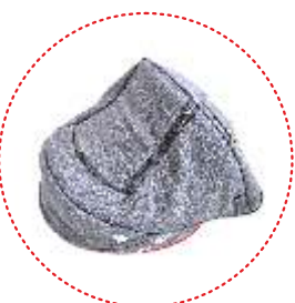
Capota con ventanilla