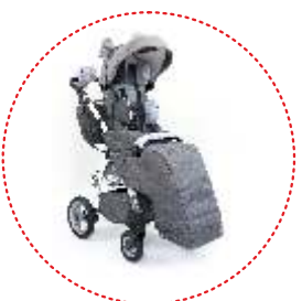
Kit de OSO GRIZZLY (elementos peludos decorativos)