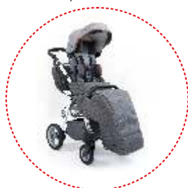
Saco de dormir para piernas