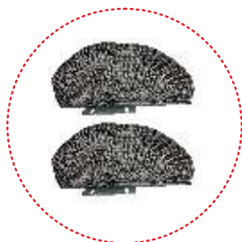
Elementos laterales del asiento