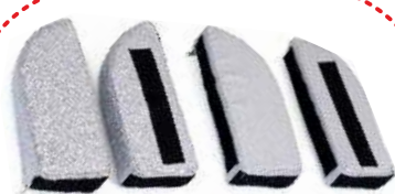
Pasy odwodząco - stabilizujące