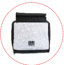
kosz na zakupy