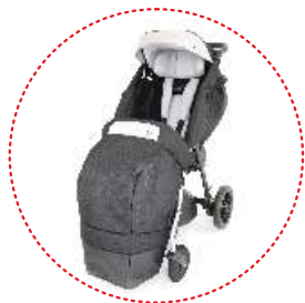
śpiwór na nogi