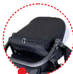
Daszek z okienkiem