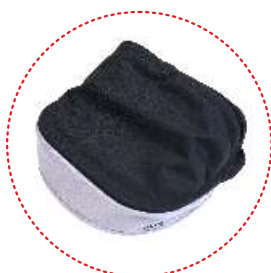
daszek z okienkiem