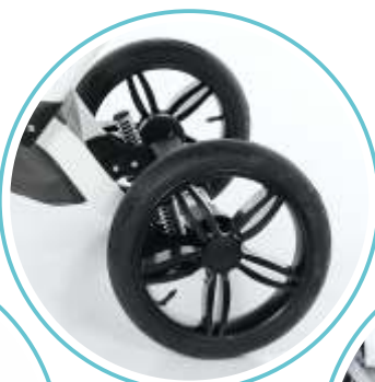
AMORTYZOWANE KOŁA Z BLOKADĄ KIERUNKU JAZDY