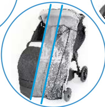
ŚPIWÓR MOSKITIERA FOLIA PRZECIWDESZCZOWA