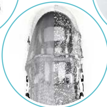
FOLIA PRZECIWDZESZCZOWA I MOSKITIERA