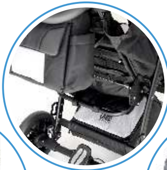
TORBA TURYSTYCZNA KOSZ NA ZAKUPY