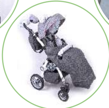
PEŁNE, AMORTYZOWANE KOŁA STOPKA PRZECHYŁOWA