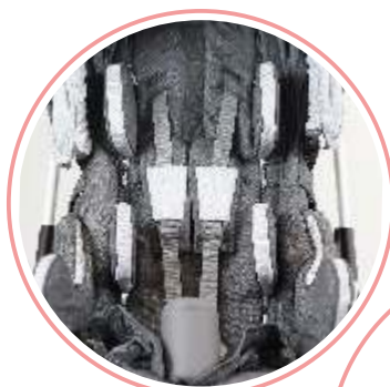
REGULOWANE PELOTY WKŁADKI ZWĘŻAJĄCE/SPLYCAJĄCE PASY PIĘCIOPUNKTOWE