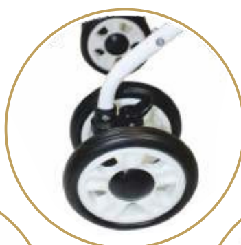
PEŁNE KOŁA ŻELOWE Z AMORTYZACJĄ I BLOKADĄ KIERUNKU JAZDY