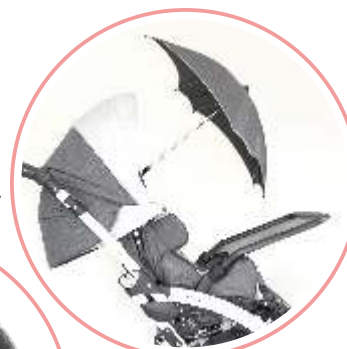
PARASOLKA PRZECIWSŁONECZNA STOLIK TERAPEUTYCZNY