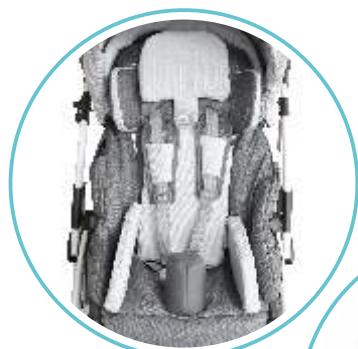
PASY PIĘCIOPUNKTOWE REGULOWANE PELOTY WKŁADKA ZWĘŻAJĄCO-SPLWYCAJĄCA