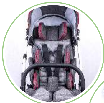
REGULOWANE PELOTY PASY PIĘCIOPUNKTOWE