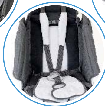
PASY PIĘCIOPUNKTOWE PASY ODWODZĄCO-STABILIZUJĄCE