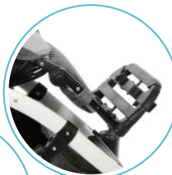
ODKREĆANY I REGULOWANY PODNOŻEK